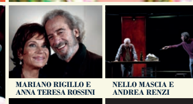
MARIANO RIGILLO E ANNA TERESA ROSSINI